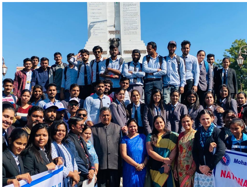
Visit of Volunteers to Constitutional Park